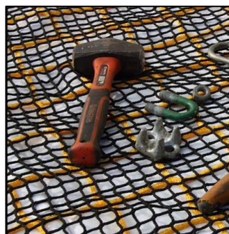
SN 7000 Sikkerhetsnett 100 mm masker