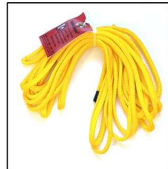
Syttau 6mm SN 96065 – 6,5m SN 96165 – 16,5m