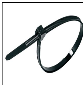
Plaststrips 4,6x200mm 100pk 7,6x380 mm 100pk