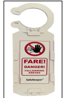
SA020 Holder til Inspeksjonsskilt for nettinstallasjon