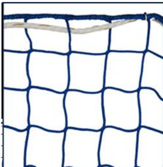
FAN100 Fallsikringsnett 100 mm masker